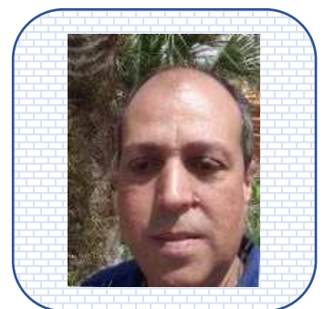
Grand filleul de Michelle

Le Grand-Parrainage inversé Luttons ensemble contre l'isolement